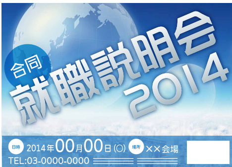
華藝体W6と合わせて活用

ユニバーサルデザインとは性別、年齢、国籍、また障害の有無を問わず、すべての人が使いやすいように製品・施設・環境などをデザインをいいます。DynaFontのUDゴシック体もそのコンセプトの基に設計された書体になっています。