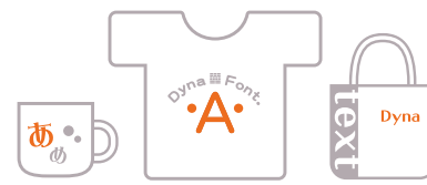
オリジナルグッズなどの新規サービス

Webブラウザやクライアント上で動作するアプリケーションからネットワークを通じてサーバーを通信し、サーバー内のアプリケーションが処理してクライアントに生成物を出力するサービスが該当します。Flashファイルなどにフォントデータをフルセット埋め込んで配信することも可能です。